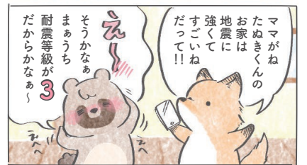
耐震等級3は等級1の1.5倍の強度だよ～☆