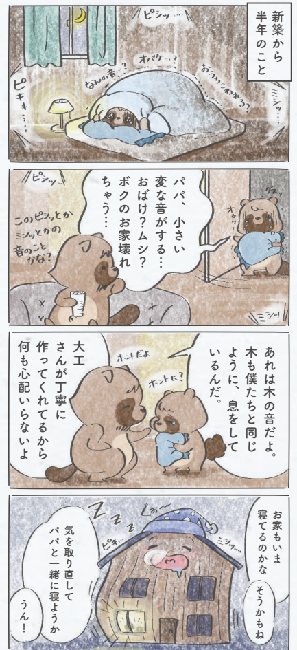
木割れの音は1シーズン経てば収まってくるよ☆