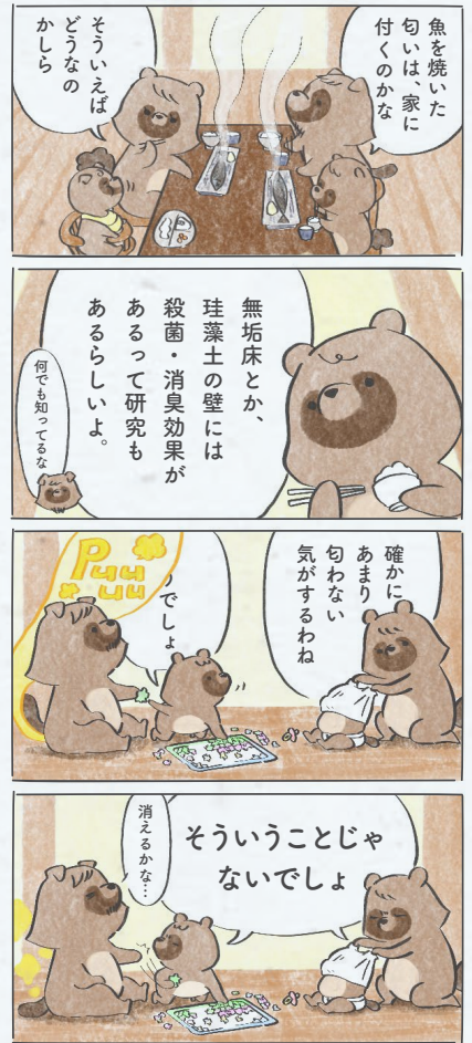
あくまで、消臭には限度があります〜☆