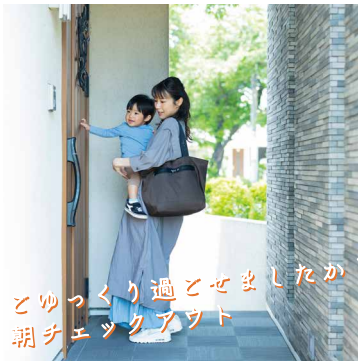
ゆっくり過ごせましたか？ 朝チェックアウト