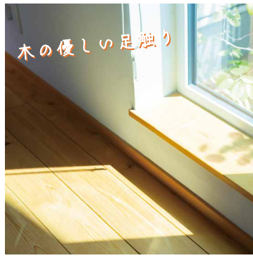
木の優しい足触り