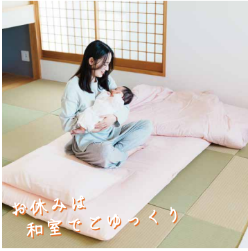
お休みは 和室でゆっくり