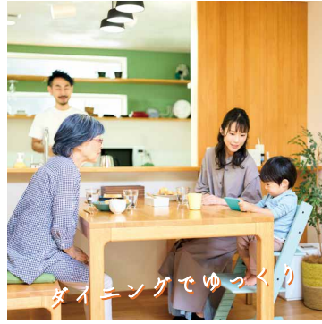
ダイニングでゆっくり