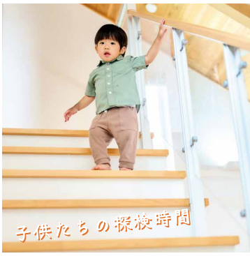
子供たちの探検時間

小嶋工務店 TOKYO WOODの家づくりをもっと知りたい、という方に向けて、宿泊体験できる施設となっております。ご家族の楽しい思い出になるように、スタッフ一同おもてなしの気持ちをもって心よりお待ちしております。