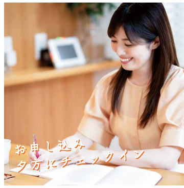
お申し込み 夕方にチェックイン