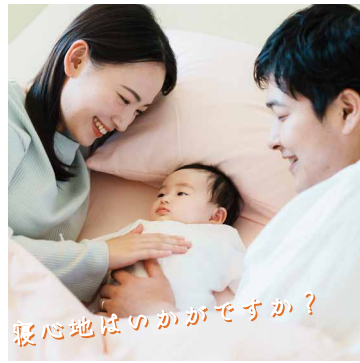
心地はいいですか？