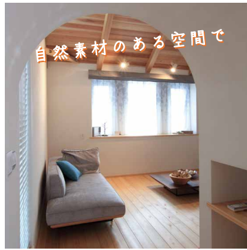
自然素材のある空間で