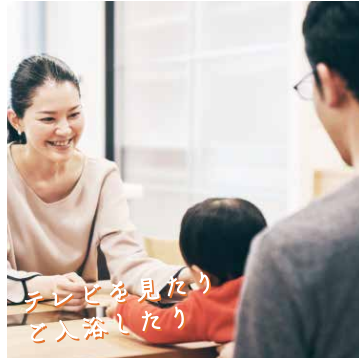
テレビを見たり お風呂したり