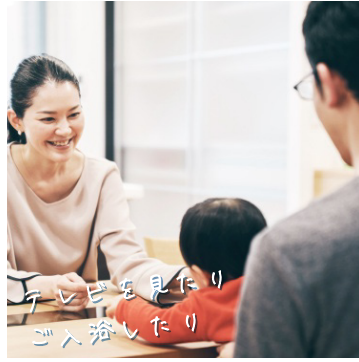
テレビを見たり ご入浴したり