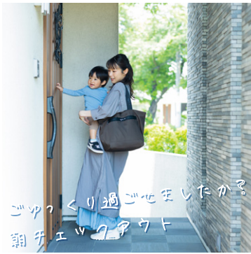
ゴックリ過ぎせましたか？ 朝食エリアアウト