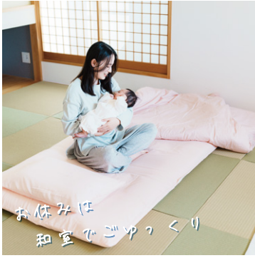
お休みは 和室でゴックリ