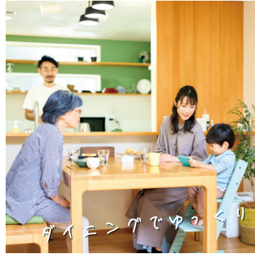
ダイニングでゆづり