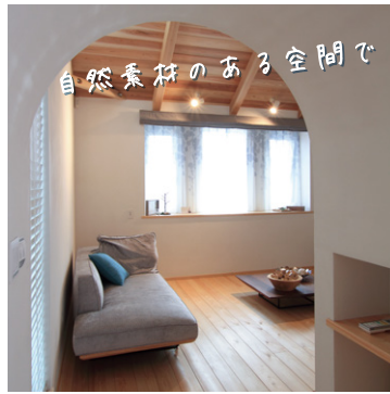
自然素材のある空間で