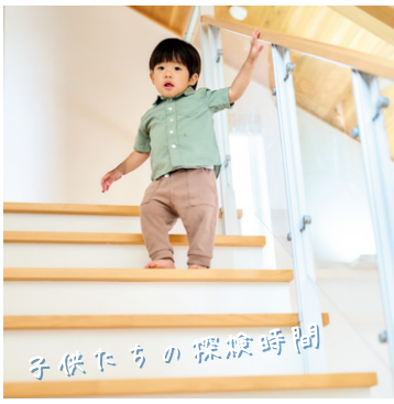
子供たちの探検時間

小嶋工務店 TOKYO WOODの家づくりをもっと知りたい、という方に向けて、宿泊体験できる施設となっております。ご家族の楽しい思い出になるように、スタッフ一同おもてなしの気持ちをもって心よりお待ちしております。