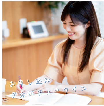
お申し込み 日にはチェックイン