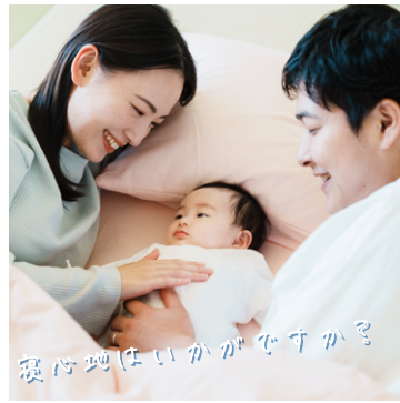
寝心地はいかがですか？