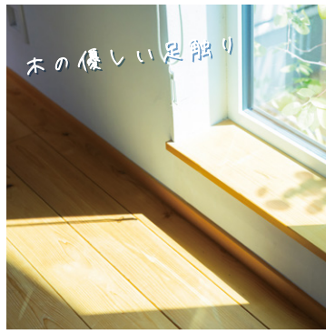
木の優しい足触り