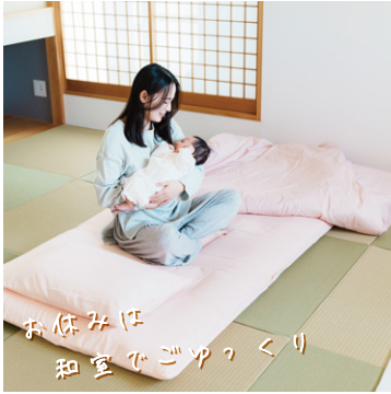
お休みは 和室でゴックウクリ