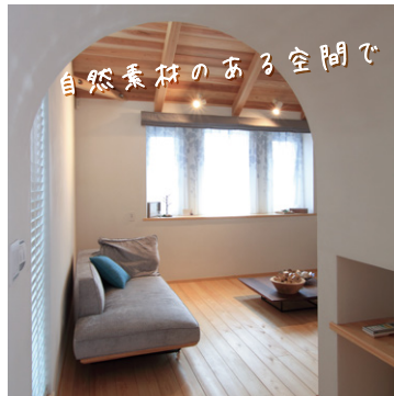
自然素材のある空間で