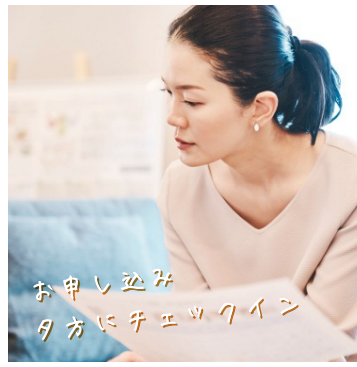
お申し込み 夕方にチェックイン