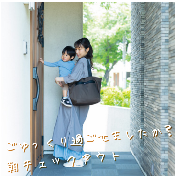
ゴックウクリ過ごせましたか？ 朝のチェックアウト