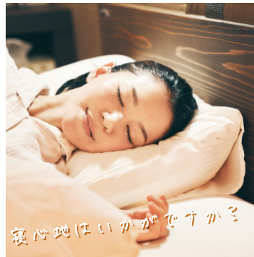
寝心地はいかがですか？