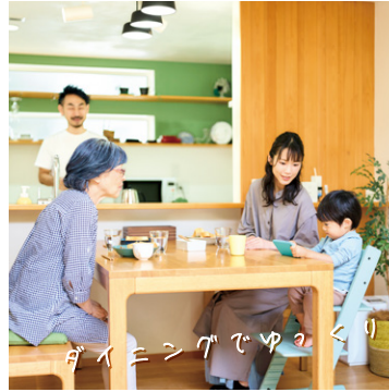
ダイニングでゆづり